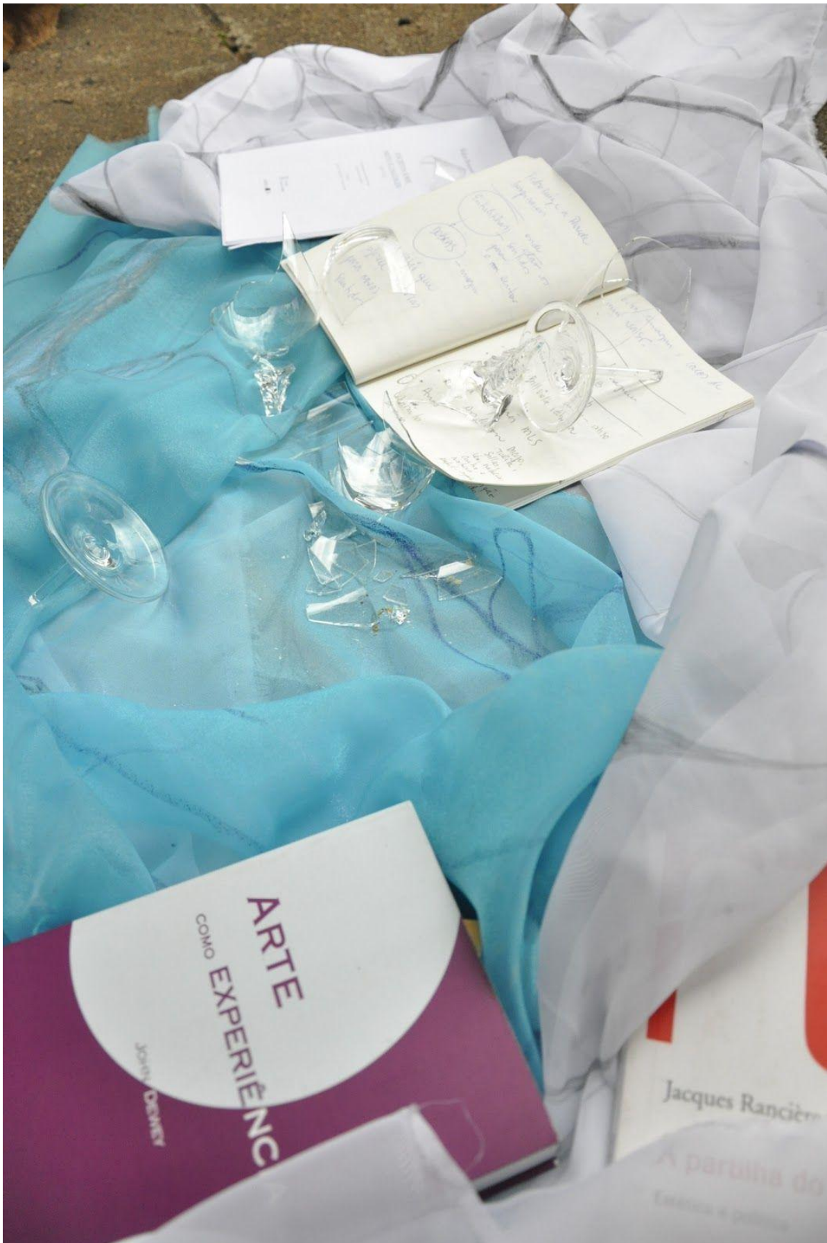
Cartografia de um processo de pesquisa baseada em arte/educação